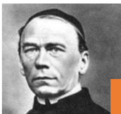
Adolph Kolping 1813 - 1865

Das Kolpinghaus ist eine Einrichtung für junge Menschen zur Begleitung während ihrer schulischen und beruflichen Ausbildung auf der Grundlage des durch Adolph Kolping gegründeten Kolpingwerkes Deutschland.